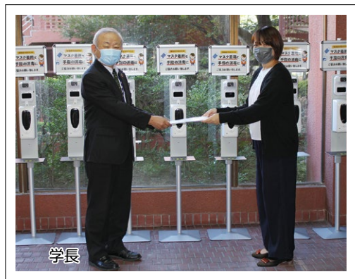
～自立型体温計贈呈式～