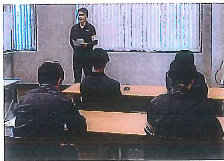
夏季インターンシップ