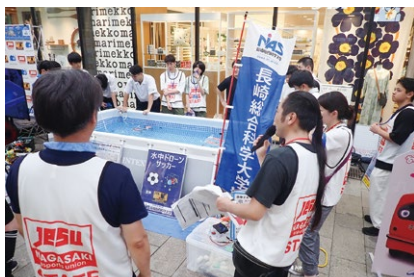
浜町イベントの様子 （船舶工学コース）