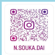
長崎総合科学大学 Instagram