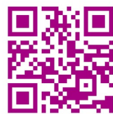
長崎総合科学大学 後援会ホームページ