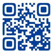
長崎総合科学大学 ホームページ